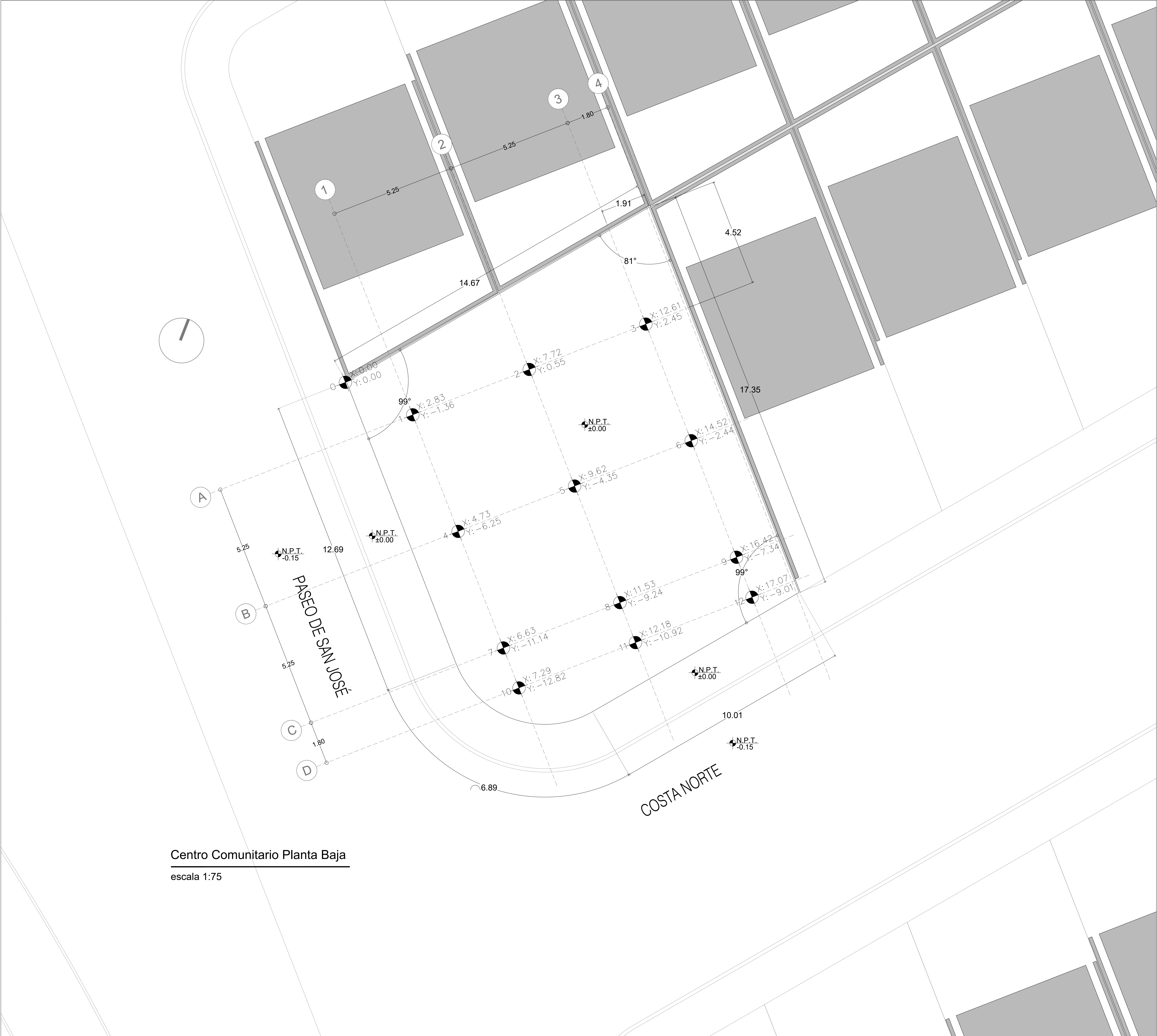
Centro Comunitario Planta Baja escala 1:75